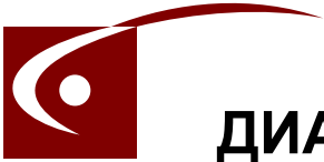
ДИАГРАММА «ФАКТОРЫ МОТИВАЦИИ»™